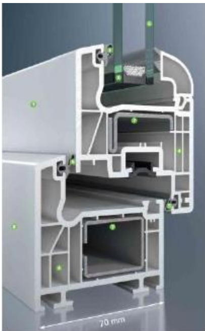
SCHÜCO CORONA CT 70 –ablakrendszer az Ön igényeire szabva

Különös figyelmet érdemel a biztonság: az acél merevítésestechnológia kiváló statikai jellemzőkkel rendelkezik. A fokozott hőszigetelési tulajdonságok ellenére a profilok elegánsak és karcsúak maradnak, sok fényt és világosságot engednek be. A SCHÜCO CORONA CT 70 ablakokkal – különösen új építkezés esetén – nagyvonalú, világostereket valósíthat meg.