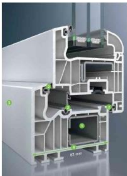
SCHÜCO CORONA SI 82 – energiatakarékos ablakrendszer belső acél merevítéssel

Különös figyelmet érdemel a biztonság: az acél merevítéstechnológia kiváló statikai jellemzőkkel rendelkezik. A kiemelkedő hőszigetelési tulajdonságok ellenére a profilok elegánsak és karcsúak maradnak, sok fényt és világosságot engednek be. A SCHÜCO CORONA SI 82 energiatakarékosablakokkal – különösen új építkezés esetén – nagyvonalú, világostereket valósíthat meg.